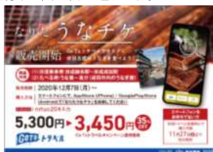
ポスターデザイン