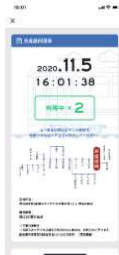
「京成線利用券」 (駅員確認画面)